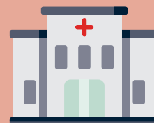
Hôpital et cliniques publiques ou privées