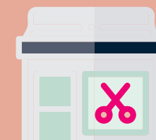
En salon, en cabine individuelle