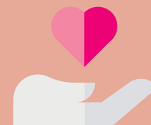
Diverses associations (Ligue contre le cancer...)