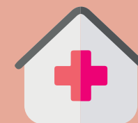
Centre de lutte contre le cancer